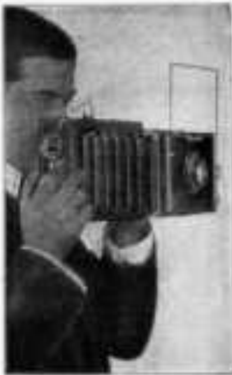
Die Deckrullo-Nettel im Gebrauch.