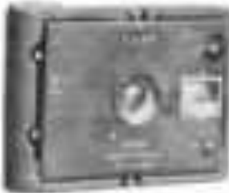
Goerz Pocket-Tenax geöffneter Zur Front-Linse

Die Konstruktion gleicht im wesentlichen demjenigen der verhältnismäßig kleinen Wammsachen-Tenax 47 x 79 mm.