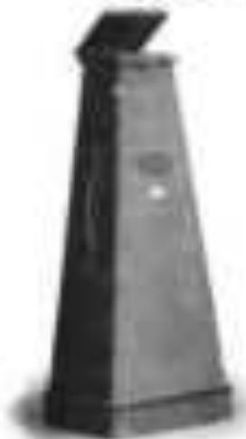
Typus 210 Vergrößerungs-Apparat Tenax, Modell I