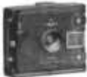
Goerz Westentaschen-Tenax gehoben im Original-Falle