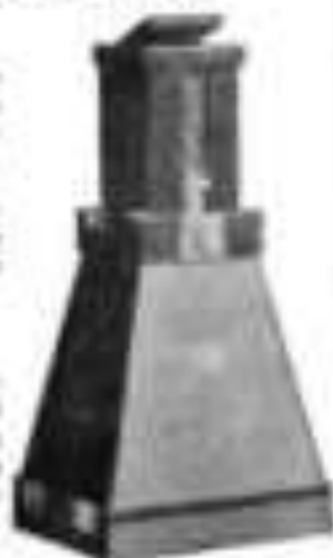
Typus 210 Vergrößerungs-Apparat Tenax, Modell II