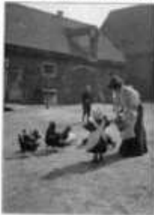
Bildchen der Goerz Pocket-Tenax 67 x 79 mm