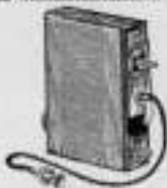
Hinten vom Objektiv

Eingelichter von \frac{1}{250} bis \frac{1}{120} Sekunde