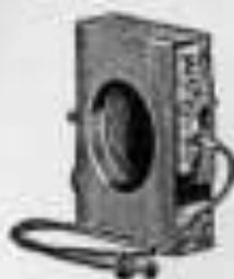
Von der Objektiv-

mit Drehauslösung für Zeit- und Momentaufnahmen